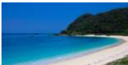
奄美大島リゾートホテル (2020年7月開業予定)