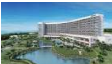
ヒルトン沖縄瀬底リゾート (2020年7月開業予定)