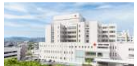
近畿地方 市民病院